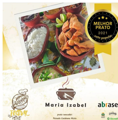
O grande vencedor do concurso melhor peixada foi o restaurante Maria Izabel! Parabéns meninas Kaká e Kaene.. Foi merecido!!