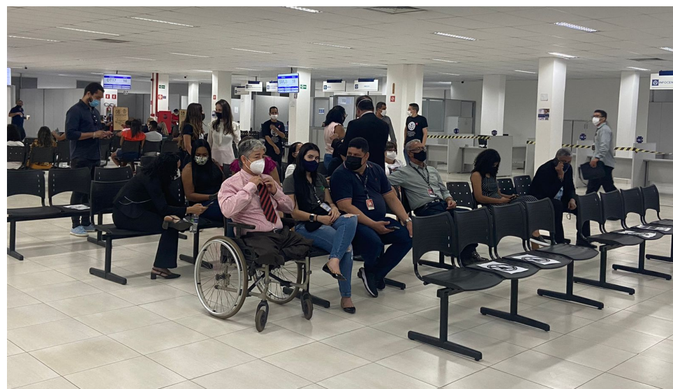
Ganha Tempo do CPA terá ferramenta tecnológica QR Code Acessível do PNE, destinada exclusivamente aos Portadores de Necessidades Especiais

“Essas pessoas estavam esquecidas em outros governos. Já a primeira-dama Virginia Mendes tem uma visão muito cuidadosa, com políticas que realizam a inclusão dessas pessoas.