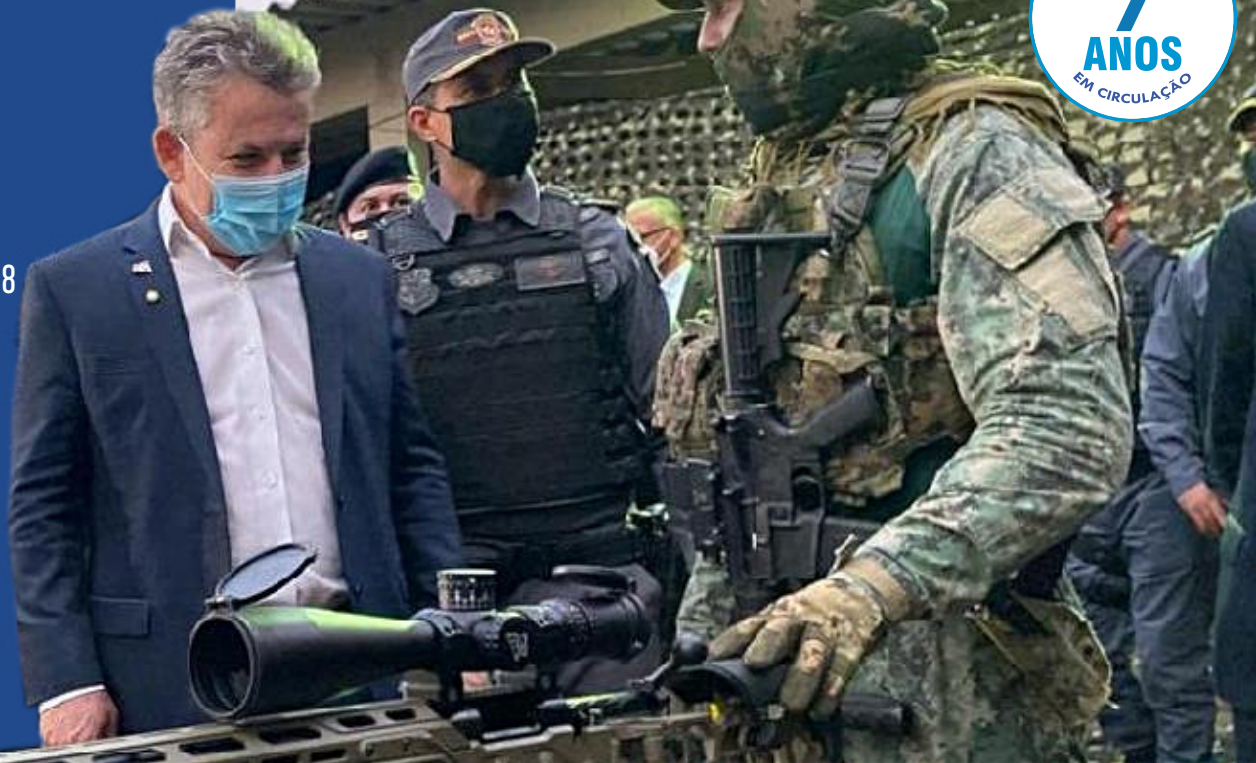
Mauro entrega novos fuzis a snipers

O governador Mauro Mendes (DEM) entregou novos fuzis de precisão calibre 308 Winchester para policiais 'snipers' do Batalhão de Operações Policiais Especiais (Bope). Inclusive, o gestor testou e aprovou a qualidade dos fuzis no stand de tiro do batalhão.