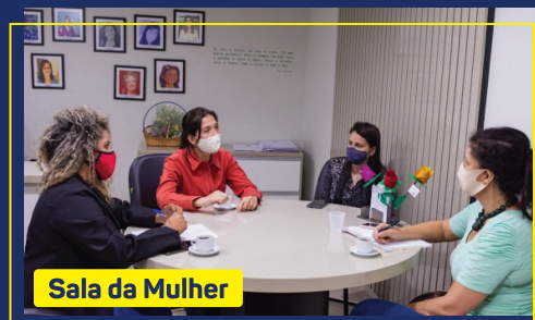
Sala da Mulher