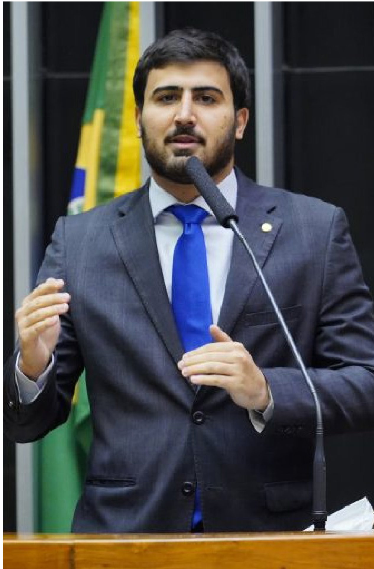
Emanuelzinho: “Após o susto com a chegada da covid-19, a população brasileira só respirou um pouco quando a vacinação de fato começou”