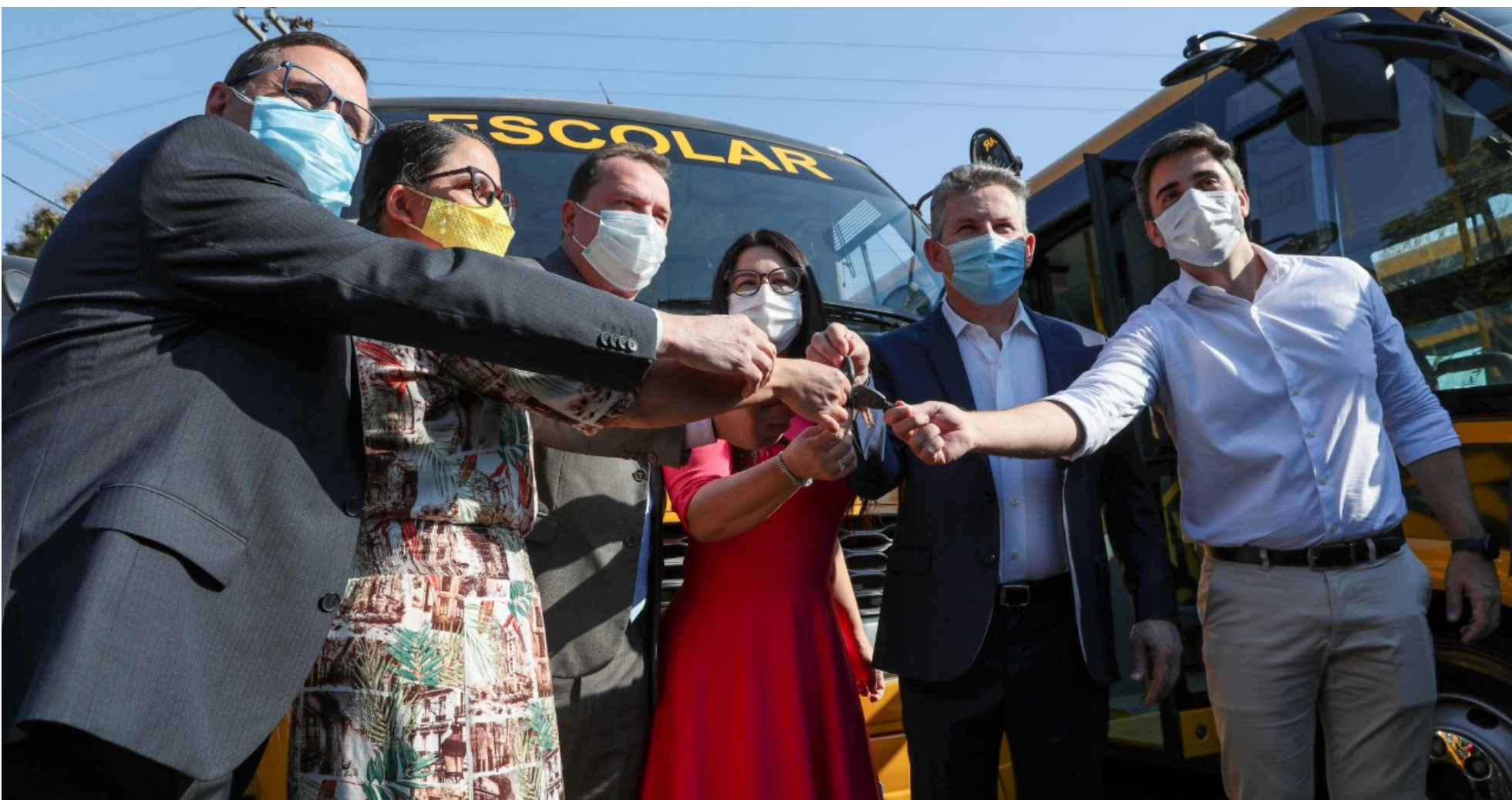
Governador Mauro Mendes, em parceria com a Assembleia Legislativa, fez a entrega dos novos ônibus escolares

O governador Mauro Mendes (DEM) entregou na semana passada ônibus escolares novos, beneficiando cinco municípios mato-grossenses. A iniciativa contou com a colaboração da Assembleia Legislativa (ALMT), por meio da destinação de emendas parlamentares que possibilitaram a compra dos veículos.