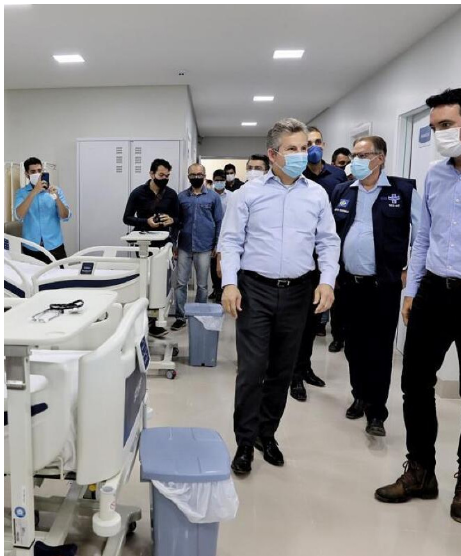
Governo Mauro Mendes tem proporcionado combate eficaz ao coronavírus, com abertura de leitos de UTIs e enfermarias em todo Estado