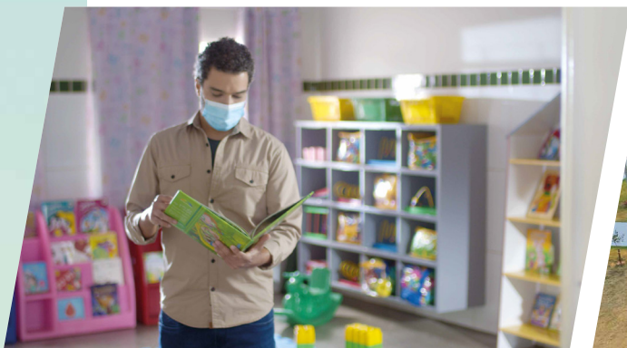
Centro de Educação Infantil Cuiabano, o CEIC.