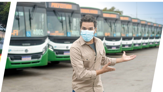
Mais de 140 ônibus novinhos, com wi-fi e ar-condicionado.