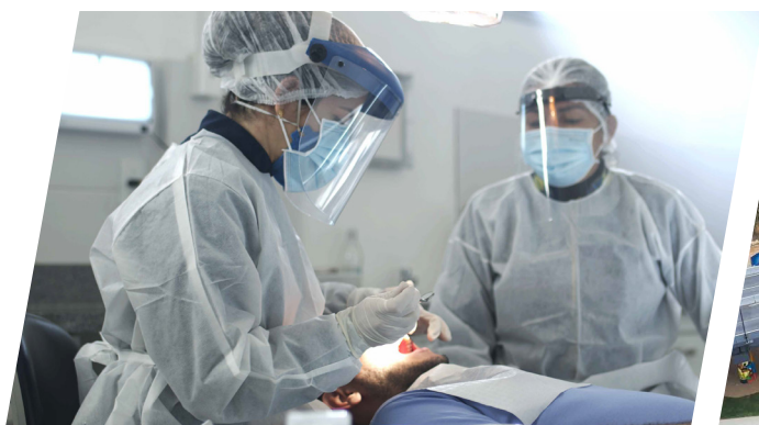
Novas unidades de saúde com hora estendida.