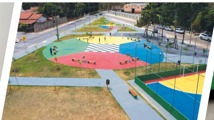
Mais de 100 praças novas e reformadas.