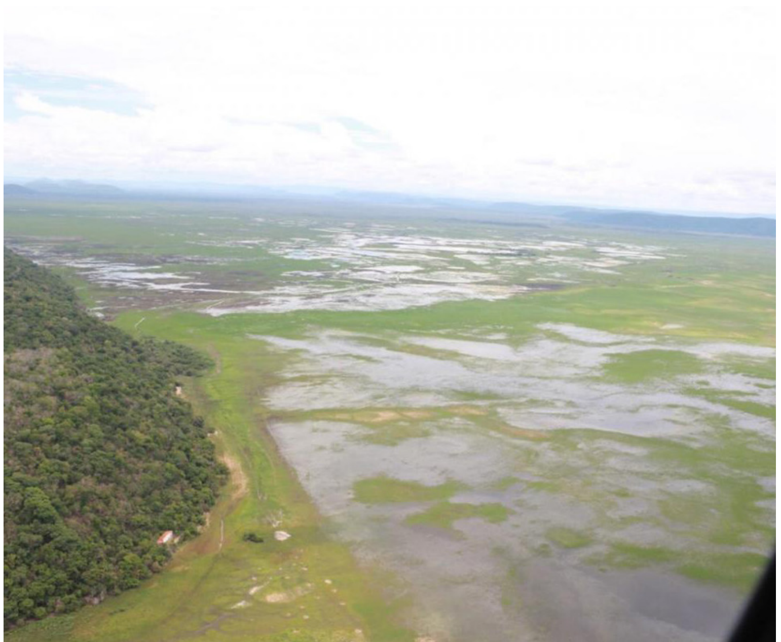
Liminar pede que governo apresente um plano de ação para resolver o problema da redução do volume de água na baía