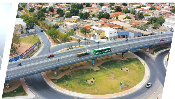
Faixas exclusivas de ônibus e dois novos viadutos.