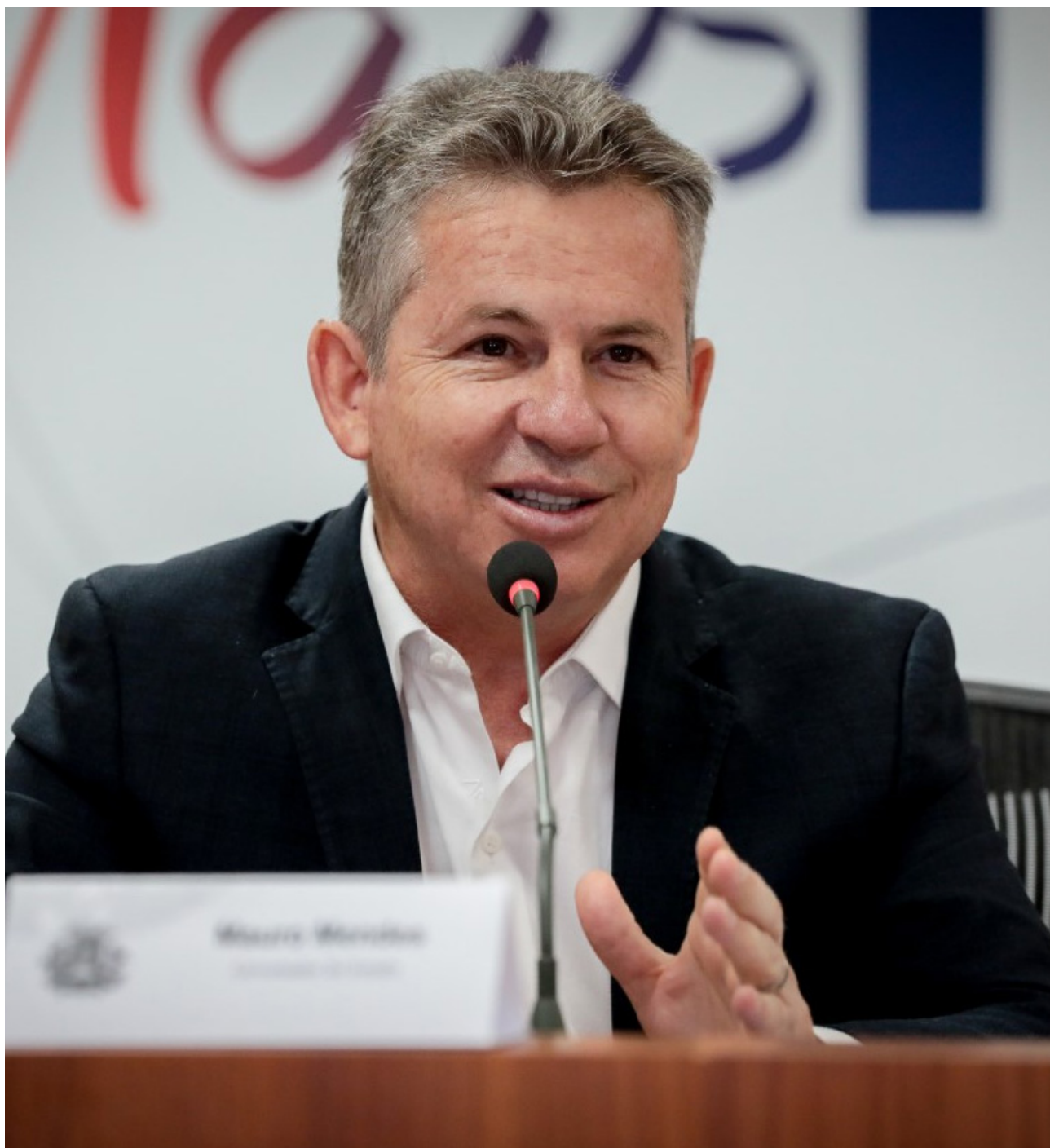
Conforme Mendes, nos próximos dias será emitida a ordem de serviço para execução de obras do Rodoanel

No Araguaia, que era tida como uma região chamada de Vale dos Esquecidos, e temos lá quase 500 quilômetros dessas obras lá, e graças a Deus nesse quesito, apesar da pandemia, apesar das dificuldades, o governo conseguiu um