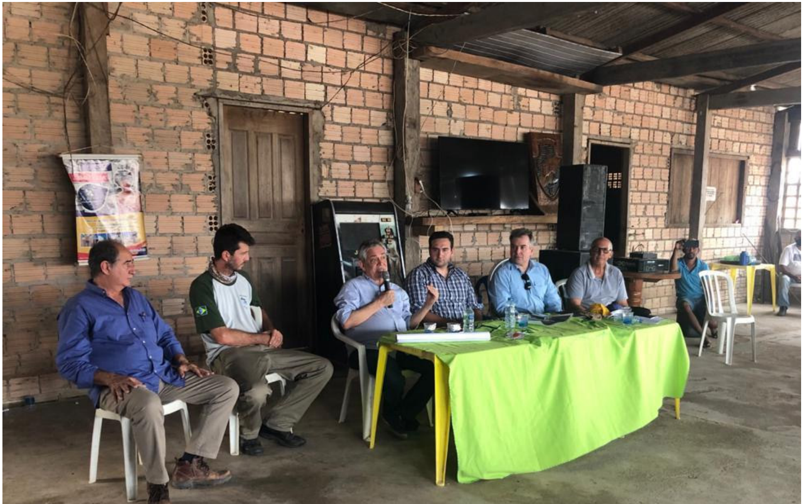
Este é o segundo garimpo regularizado em dois anos, o primeiro foi em Aripuanã, onde foram cedidos 519 hectares e atualmente trabalham mais de 2 mil homens

Na ocasião foram vistoriados os garimpos de Zé Vermelho, em Paranaíta, Pista do Cabeça, em Alta Floresta, e Novo Astro,