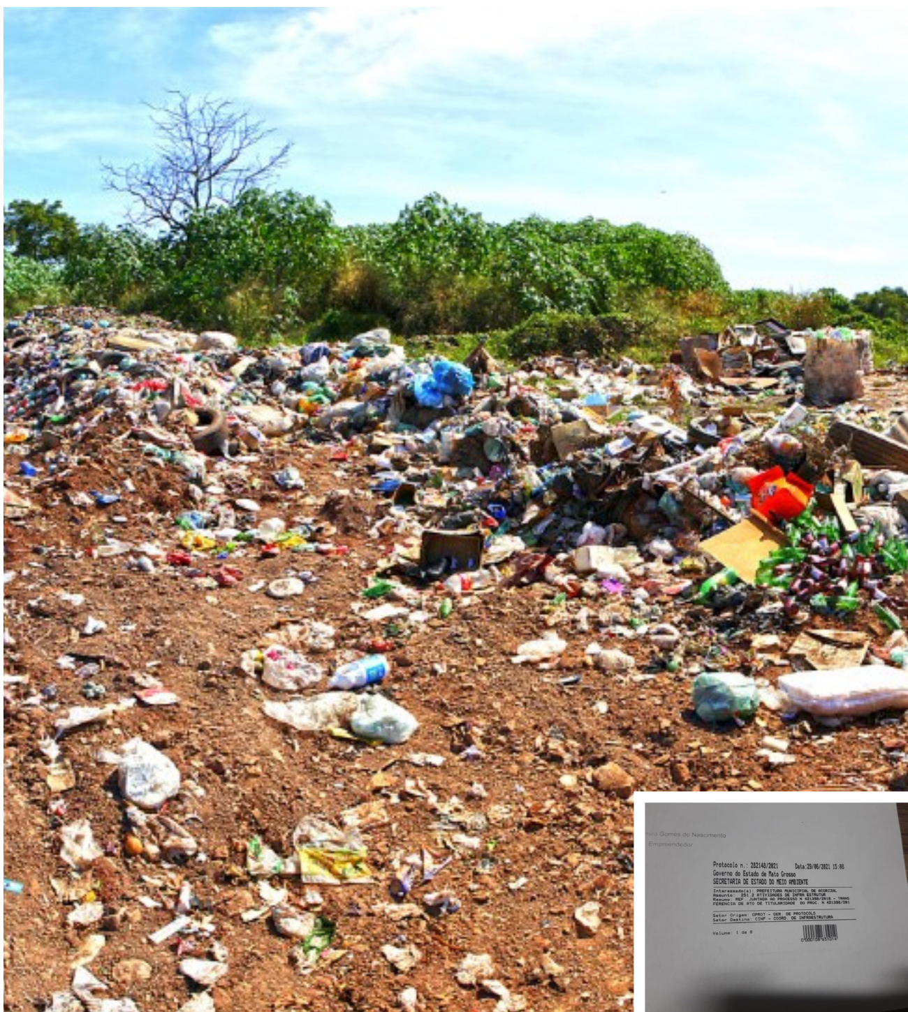
Novo Marco Legal do Saneamento Básico exige o encerramento de lixões a céu aberto