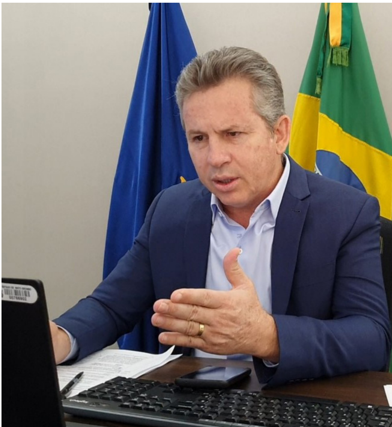
Mauro lembra que ninguém ouviu falar que nos hospitais do Governo do Estado faltou oxigênio ou medicamento

Mauro mais uma vez afirmou que a vacina é o caminho mais seguro no combate a covid-19 e que o Brasil não está na velocidade de imunização que