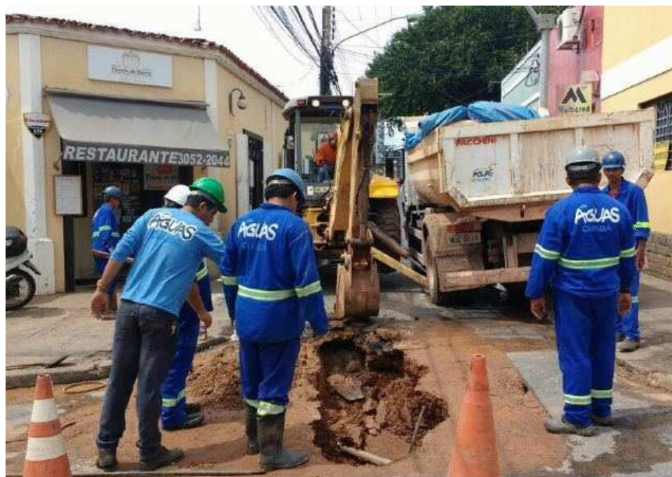
Concessionária trabalha em sintonia com a Prefeitura de Cuiabá

100% das residências cuiabanas passarão a ter água tratada em suas torneiras, sanando de forma definitiva a escassez.