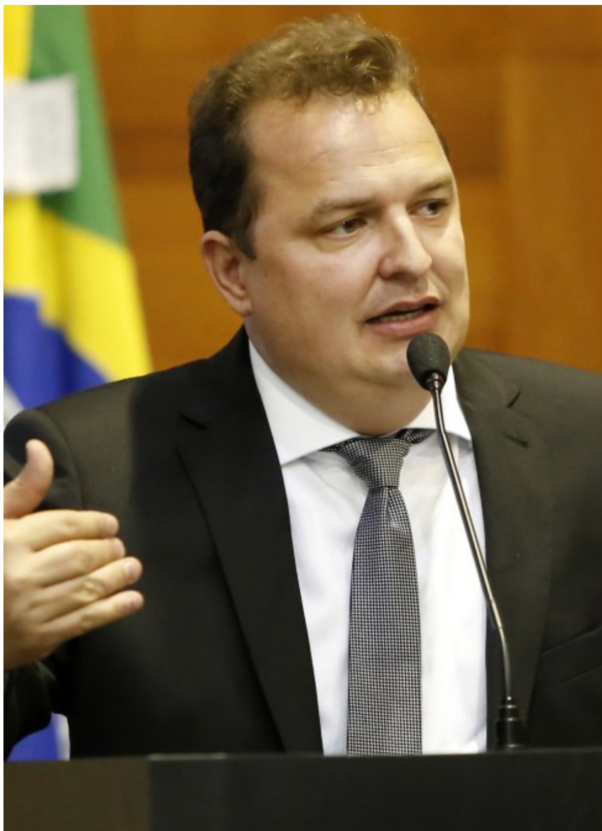
Max Russi nega que haja descontentamento dos deputados com o governador Mauro Mendes