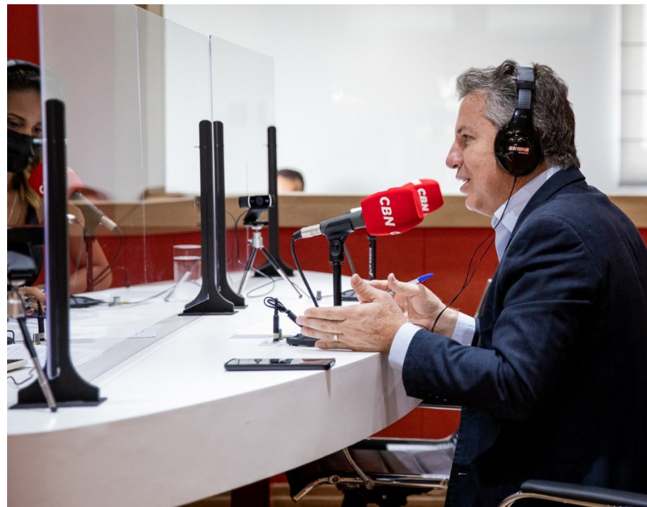
Mauro Mendes diz que Cuiabá já vem sendo beneficiada pelo programa Mais MT