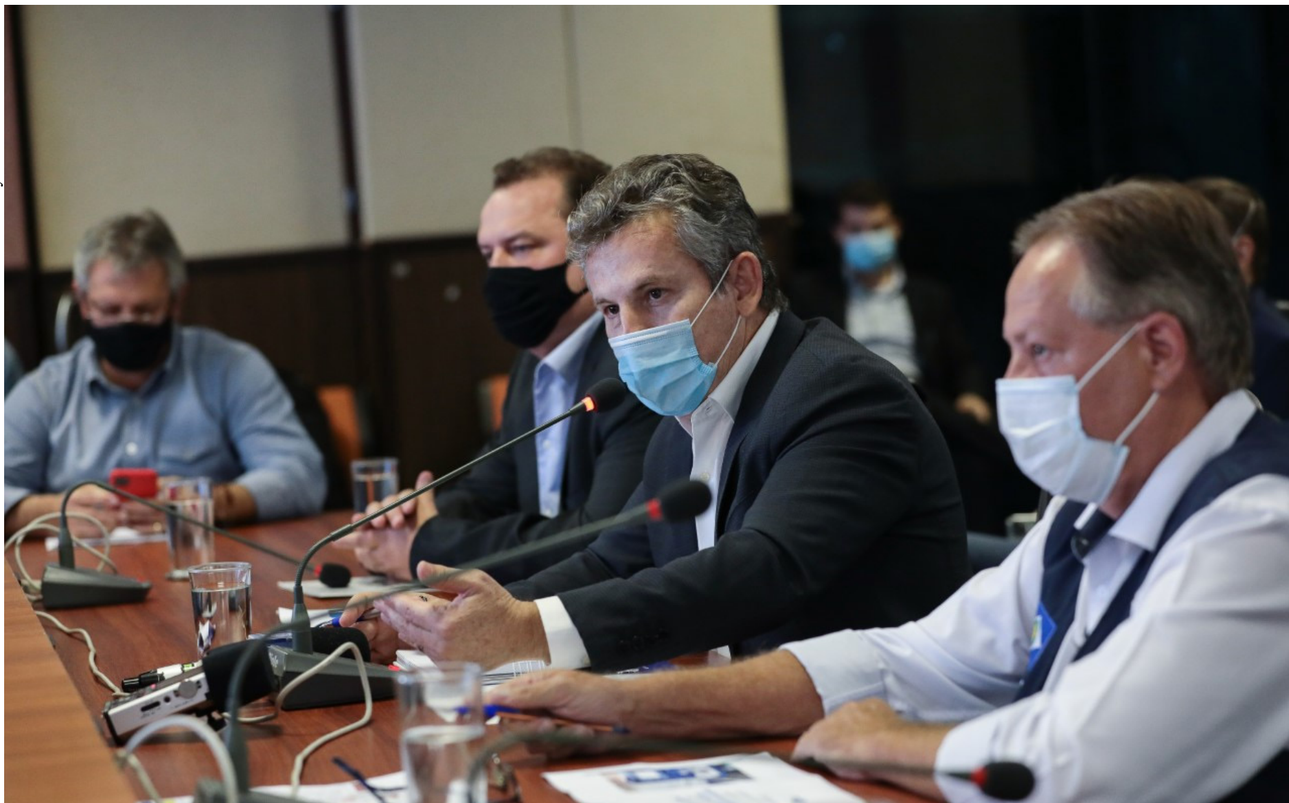
Governador Mauro Mendes e secretário de Saúde, Gilberto Figueiredo, anunciam novas medidas de combate a covid-19

O Governo do Estado anunciou abertura de mais 500 leitos clínicos e 160 de Unidade de Terapia Intensiva (UTI's) em Mato Grosso. A iniciativa levantou o questionamento quanto à falta de profissionais da saúde disponíveis para operar os leitos.