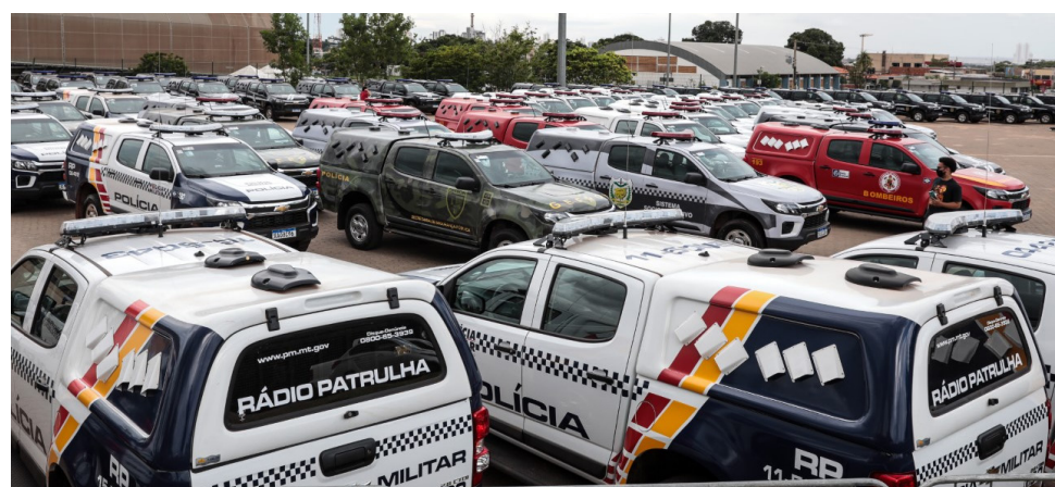
Governo do Estado entregou 250 viaturas às forças de segurança de Mato Grosso

"É um importante investimento para equipar todos os nossos batalhões,