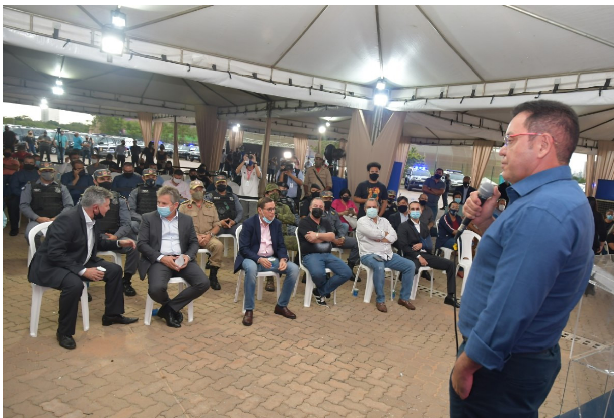
Botelho: "Estamos começando a colher os resultados. Entregamos maquinários agrícolas para a agricultura familiar e novas viaturas para a segurança pública"

"Quem paga em dia, compra bem. O Governo do Estado recuperou sua credibilidade e tem fama de bom pagador no mercado. Por isso conseguimos aplicar o dinheiro do cidadão de forma mais eficiente, com grandes descontos. Economia que é revertida em mais serviços e ações aos mato-grossenses", afirmou.