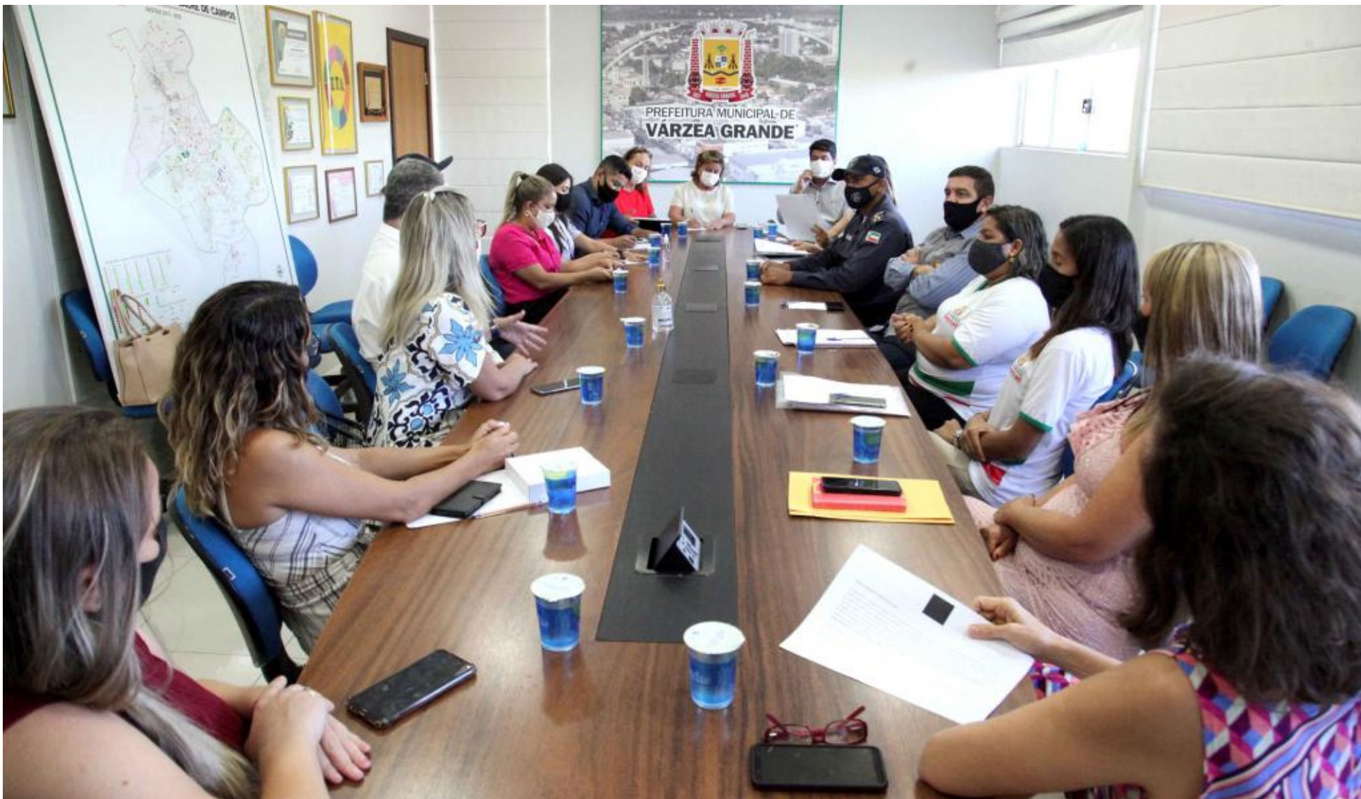
A reunião foi solicitada pela Rede para o alinhamento técnico-político estratégico, com a entrega do relatório de monitoramento e avaliação da articulação