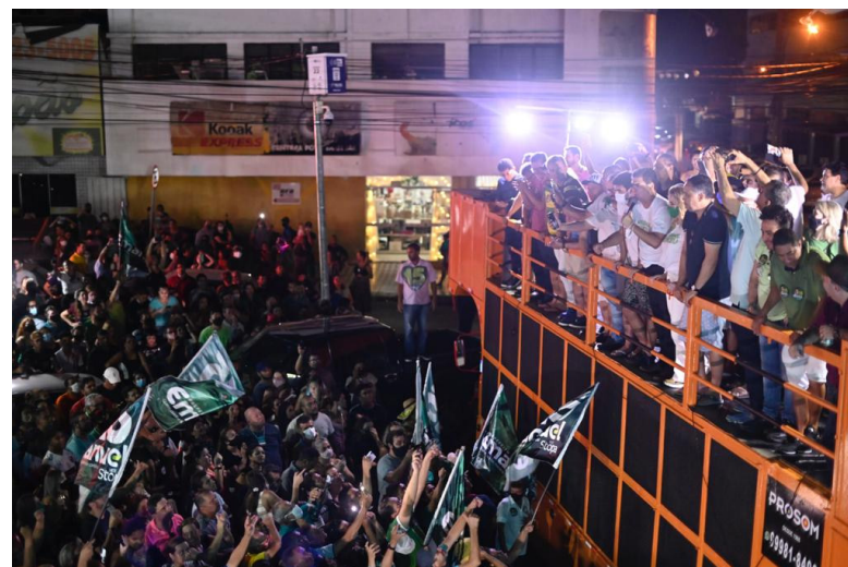
Eleitores celebram vitória de Emanuel Pinheiro em Cuiabá, com festa na Praça do Choppão