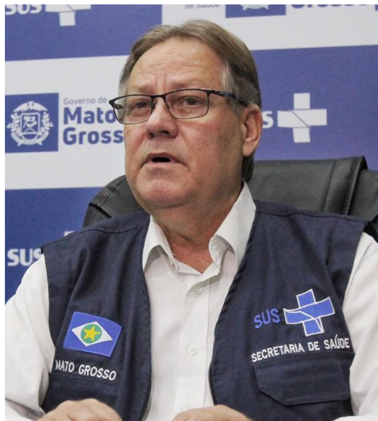
Secretário estadual de Saúde, Gilberto Figueiredo