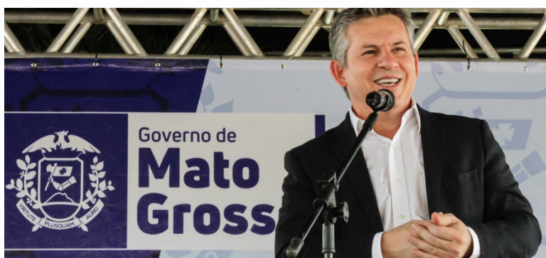
Governador Mauro Mendes

Apenas este ano, os investimentos somam R$ 150 milhões, que estão sendo empregados na construção e melhorias das escolas da rede estadual de ensino