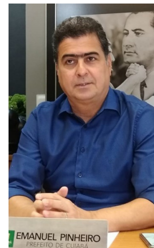
Prefeito Emanuel Pinheiro