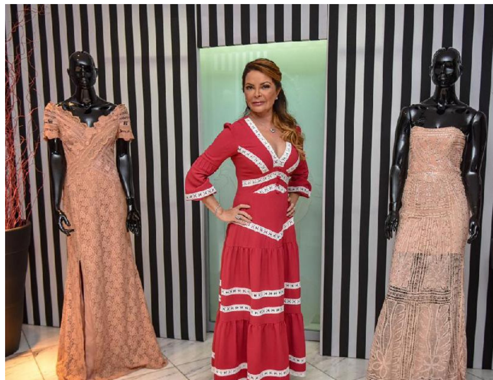
Todo o dinheiro arrecadado será convertido para ações sociais