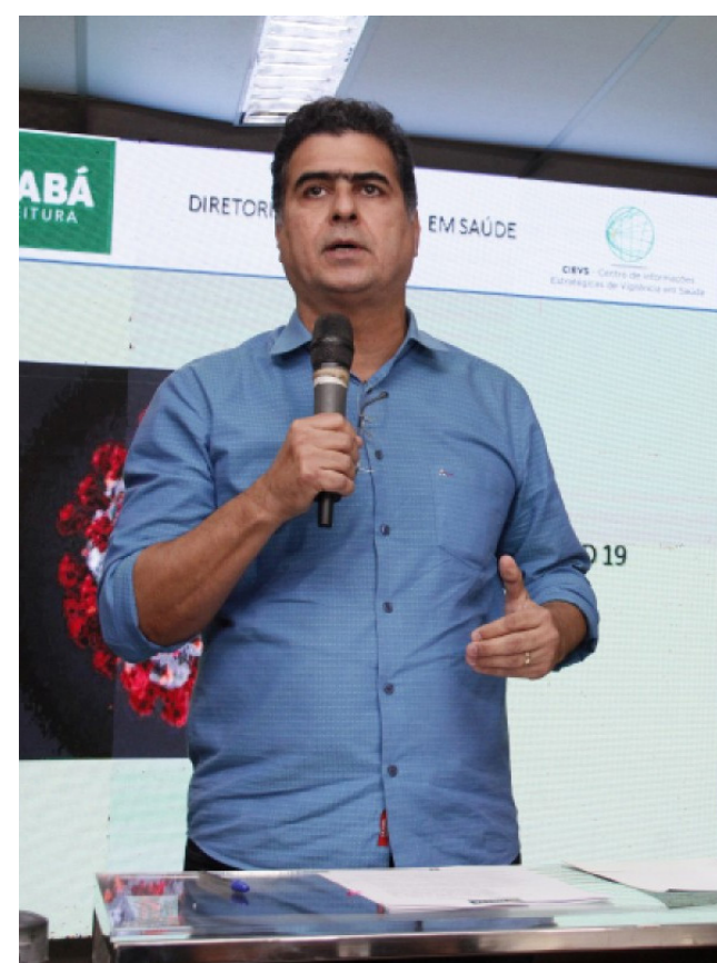
Emanuel Pinheiro começa campanha eleitoral com amplo favoritismo, liderando todas as pesquisas

Conforme o cientista, o povo brasileiro em si não dá muita importância para denúncias. “Não é só em relação as denúncias contra Emanuel, mas de qualquer outro político. Problemas de ordem moral não atingem todo mundo. O brasileiro não tem muito essa questão como relação de critério de votação”, pontuou.