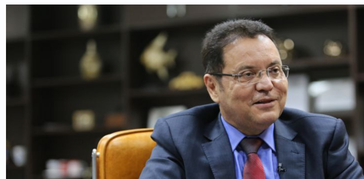
Deputado Eduardo Botelho é defensor ferrenho da agricultura familiar no Parlamento estadual