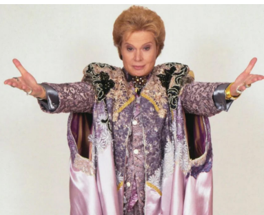
O documentário Ligue Djá: O Lendário Walter Mercado está disponível para os assinantes da Netflix desde o dia 8 de julho de 2020.

Se você foi criança ou adolescente nos anos 1990, certamente esbarrou em Walter Mercado enquanto assistia a Cavaleiros do Zodíaco, Black Kamen Rider ou Super Catch na TV Manchete e se perguntou: quem danado é esse homem (ou seria mulher?) cheio de spray no cabelo e roupas esquisitas pedindo para eu ligar para ele?