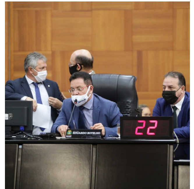
Mesa Diretora da AL votou matérias que reduzem o custo de importação e produção de artigos usados nas unidades hospitalares

De acordo com as proposições, por motivo inesperado na saúde pública causado pelo novo coronavírus, as cidades não precisam, por exemplo, cumprir os prazos legais para contratação imediata de pessoal para fazer frente às necessidades emergenciais no combate à Covid-19.