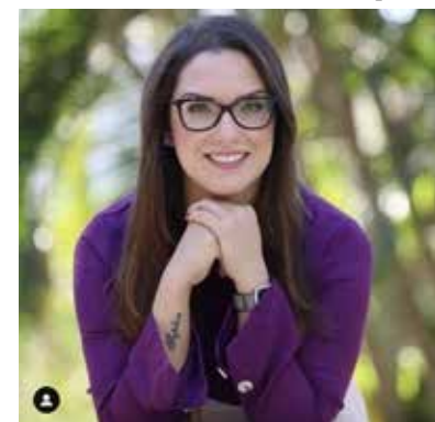
Janaina Riva é bacharel em Direito, deputada estadual mais votada da atual legislatura e vice-presidente da Assembleia Legislativa de Mato Grosso.