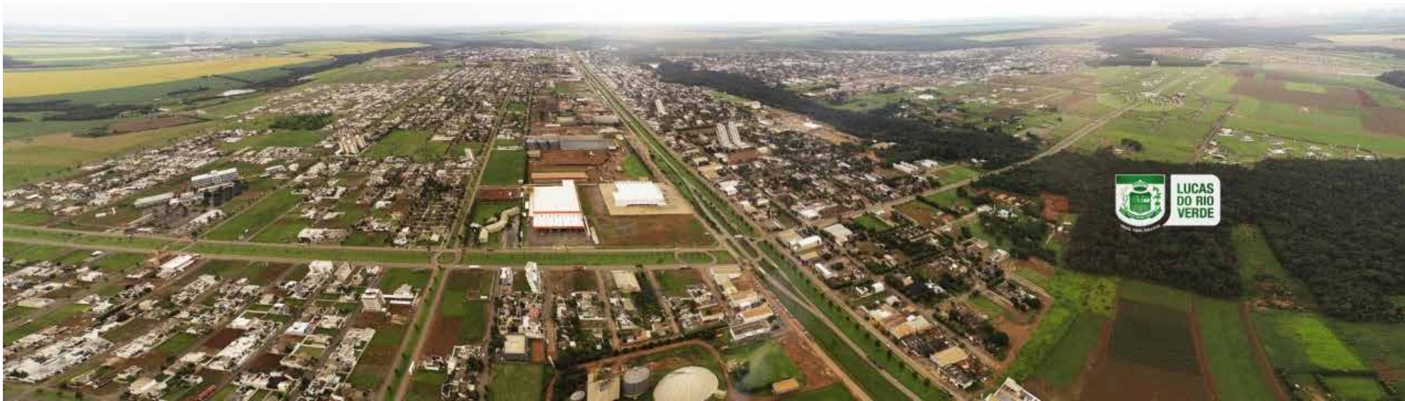
Município completa 32 anos com lançamento de obras