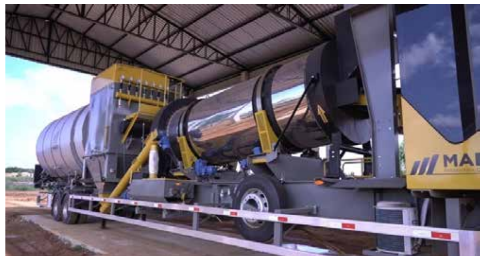
Usina de CBUQ (Concreto Betuminoso Usinado a Quente) vai garantir a produção própria do asfalto

tura, com a contratação de mais profissionais de saúde e readequação do fluxo durante a pandemia do Coronavírus.