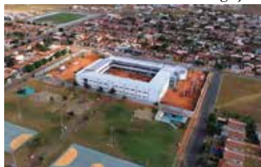
Prefeito Luiz Binotti prepara a entrega da Escola Cora Coralina no bairro Jaime Seiti Fujii