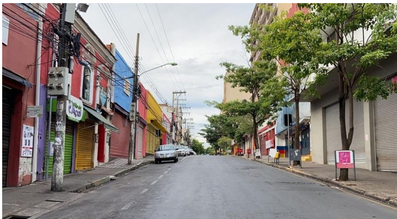
Durante pandemia, comércio esteve na maior parte de portas fechadas, aumentando a crise no setor