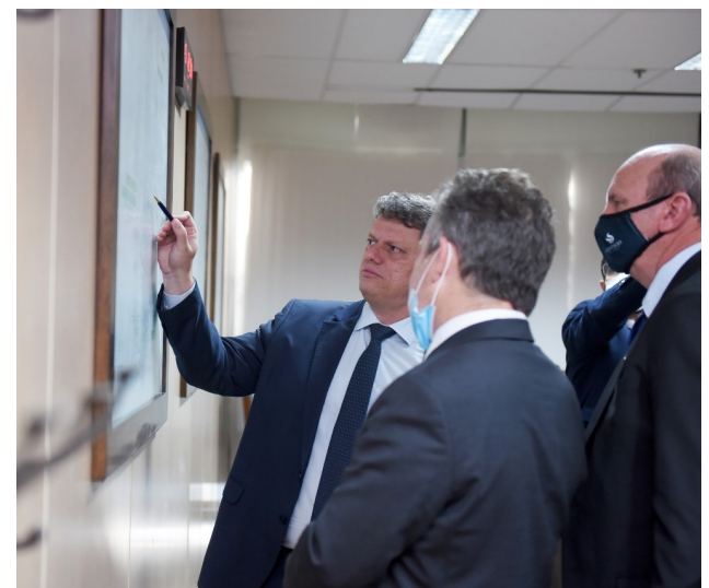
Ministro de Infraestrutura, Tarcísio de Freitas garante a Mauro Mendes continuidade da duplicação da BR-163