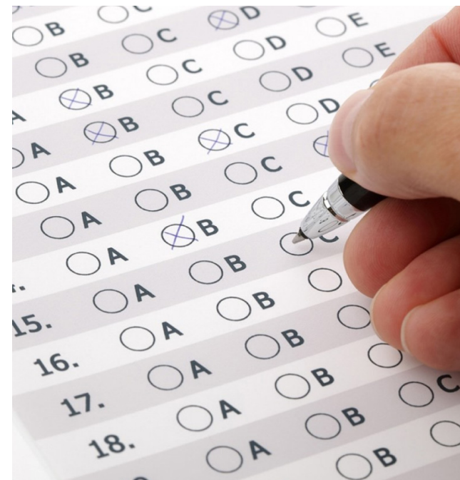
Todas as etapas do presente Edital serão realizadas na cidade de Cuiabá-MT

As inscrições poderão ser realizadas entre os dias 6 e 17/07/2020 e serão realizadas por meio de preenchimento de formulário eletrônico, visando facilitar o acesso e garantindo a saúde e segurança dos candidatos e servidores da AGER/MT. Não será cobrada taxa de inscrição.