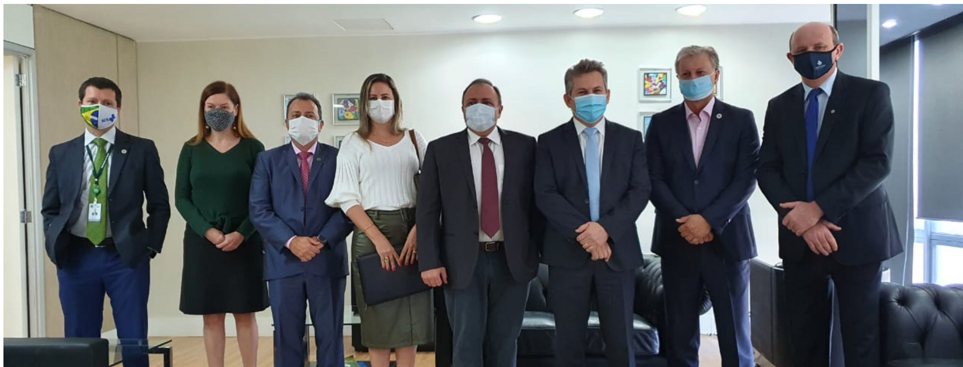
Governador Mauro Mendes e representantes da Secretaria de Saúde em reunião com o ministro da Saúde, Eduardo Pazuello