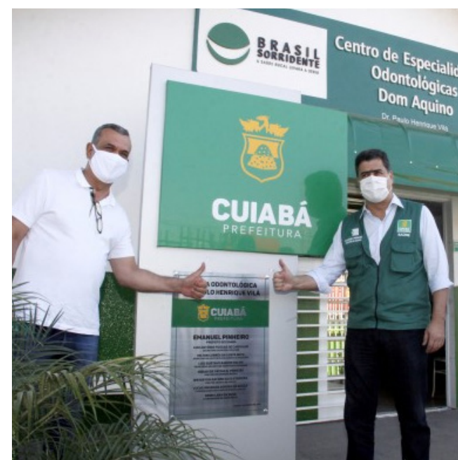
Emanuel Pinheiro entrega Centro de Especialidades Odontológicas no bairro Dom Aquino totalmente reformado

São prevenções, são cuidados com a vida das pessoas muito importantes para o paciente SUS, para aquelas pessoas que não têm dinheiro para pagar um médico particular ou um hospital privado. A nossa obrigação, enquanto gestores, é priorizar e dar cada vez mais eficiência e qualidade no SUS para atender com respeito e humanização a nossa população”, afirmou.