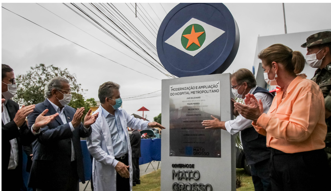
Governador Mauro Mendes entrega ampliação do hospital metropolitano em Várzea Grande

Mauro Mendes também assinou a ordem de serviço para início das obras de construção de duas pontes de concreto na rodovia MT-326, sobre os rios das Mortes e