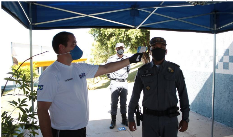
Segurança Pública de Mato Grosso vem tomando medidas para evitar a contaminação pelo coronavírus