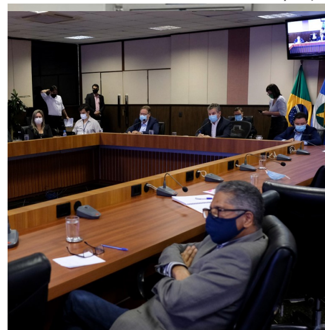
Mauro Mendes diz que Baixada Cuiabana ficará bem atendida com a abertura dos novos leitos