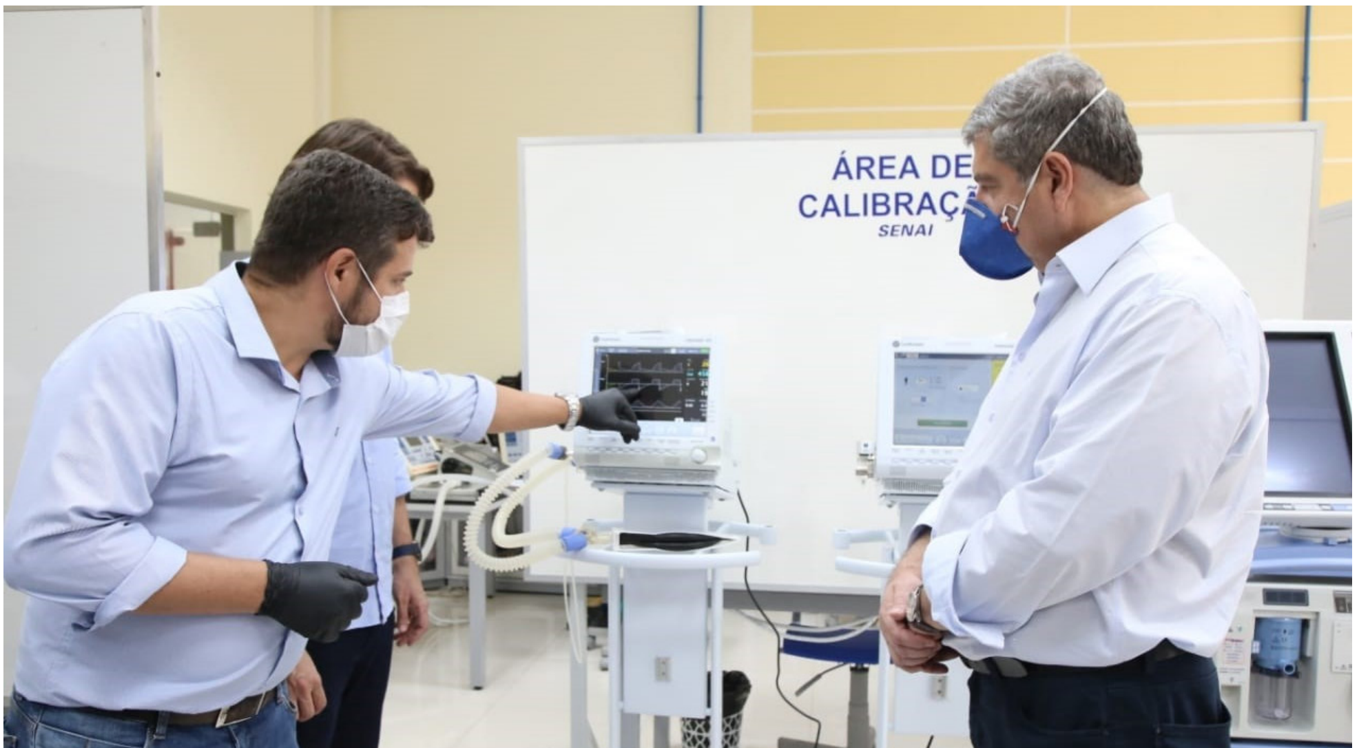
Dos 118 respiradores recebidos para avaliação e manutenção, 28 foram arrumados e entregues para as unidades hospitalares