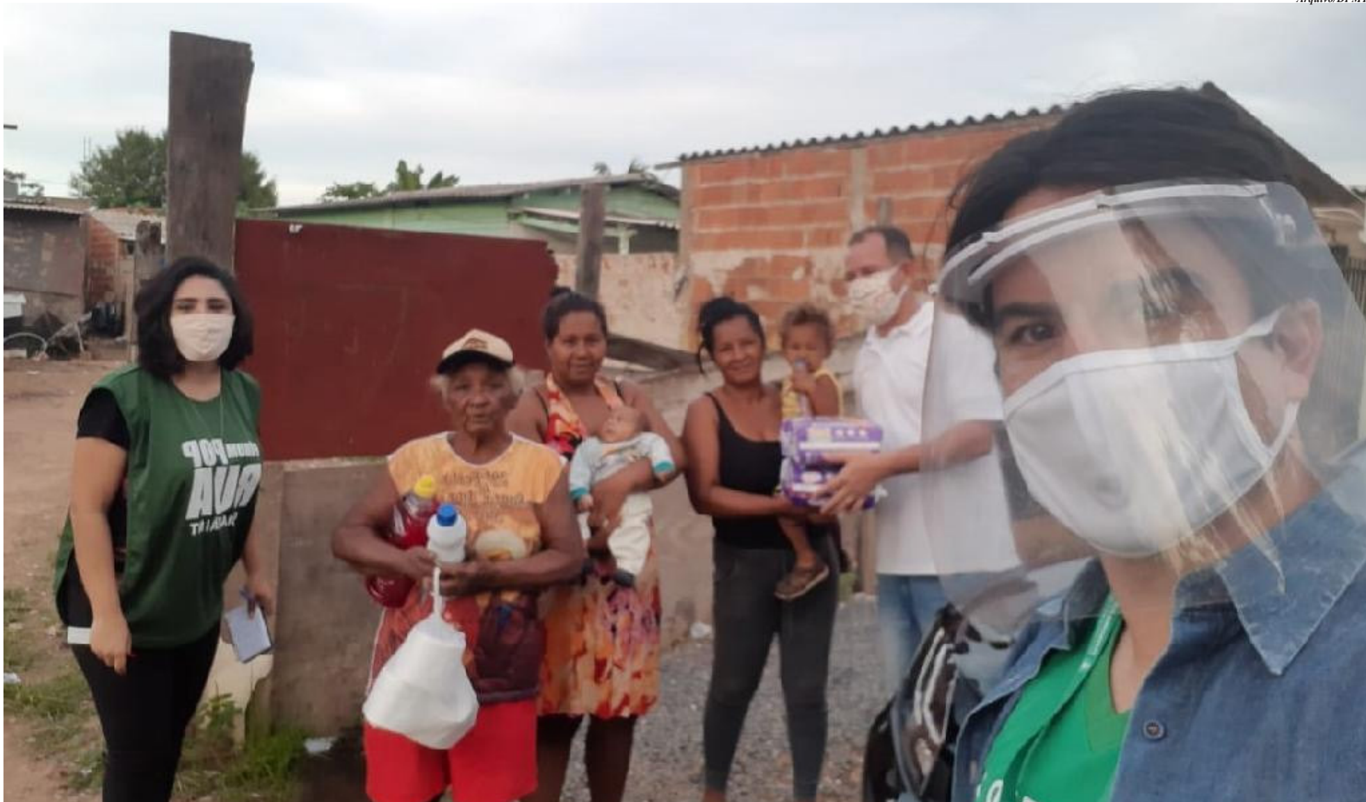
Defensores públicos levam doações e assistência jurídica gratuita a famílias carentes de Cuiabá e Várzea Grande

Mais de dez bairros carentes da Região Metropolitana de Cuiabá já foram beneficiados com o projeto Conexão Solidária, que distribuiu mais de 200 marmitas, 100 cestas básicas, 100 kits de lanche para crianças e 50 kits de limpeza, além de roupas, calçados e medicamentos, diminuindo os impactos sociais devido ao distanciamento social imposto pela pandemia do novo coronavírus (Covid-19). A ação é organizada pela Associação Mato-grossense dos Defensores Públicos (Amdep).