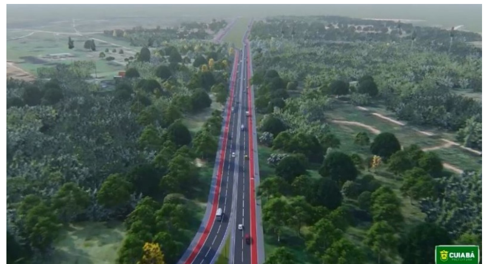
A previsão é de que nas próximas semanas o resultado seja homologado e o contrato assinado

A obra será composta pelas etapas de terraplanagem, drenagem, pavimentação, sinalização e