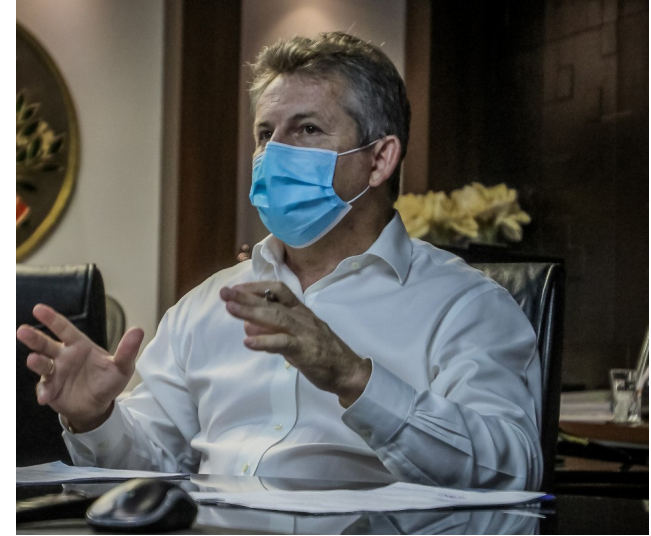
Mauro Mendes: “Agora que o sistema de saúde está começando a lotar e agora é que deveria parar para que o sistema de saúde não caminhe para o estrangulamento”