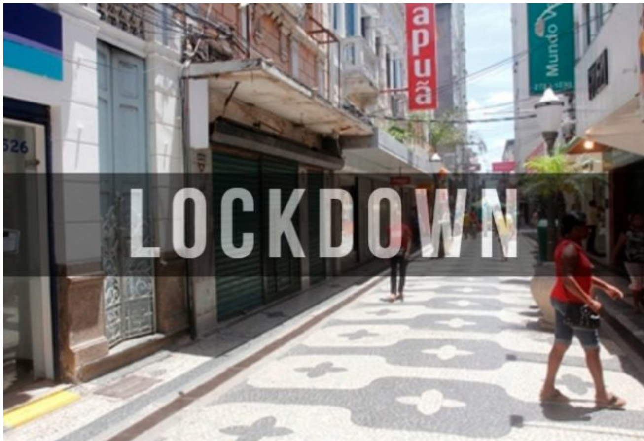
O Lockdown é o termo em inglês para confinamento ou isolamento compulsório, e pode ter diferentes graus de rigor

Consiste em restringir a circulação da população em lugares públicos, permitindo apenas, e de forma limitada, para questões essenciais, como ir à farmácias, supermercados ou hospitais. O descumprimento dessa regra pode acarretar multas e em toque de recolher, dependendo do governo local.