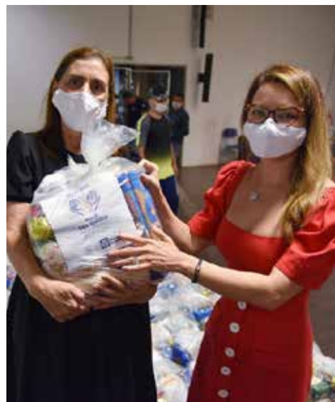
A primeira-dama do Estado, Virginia Mendes