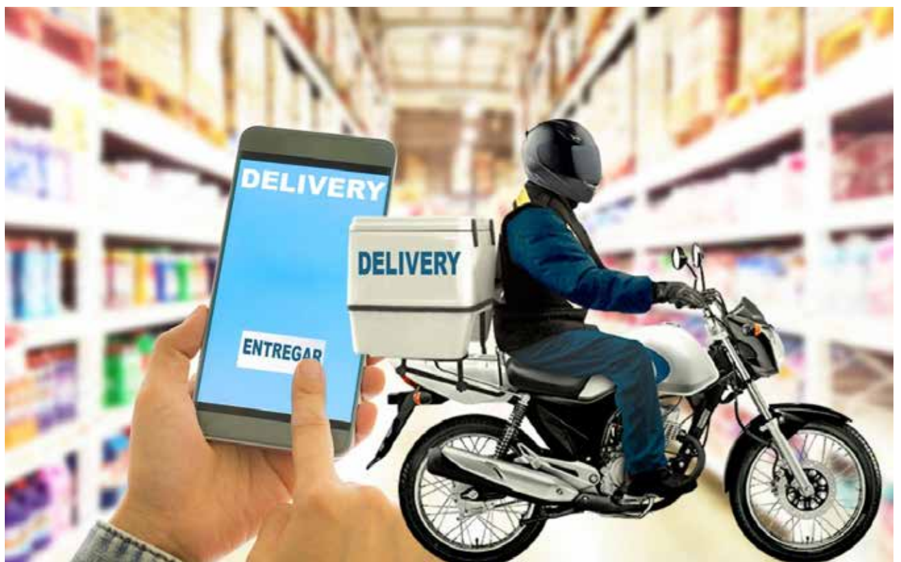
Segundo o superintendente da CDL Cuiabá, Fábio Granja, o delivery foi uma revolução, pois anteriormente era utilizado apenas pelo setor alimentício

De acordo com Fábio, houve uma percepção