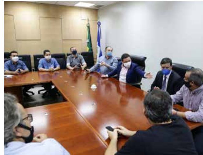
Botelho tem recebido pedido de apoio de diversos segmentos da economia nesse momento de crise causada pelo coronavírus

Temos que ter equilíbrio, o governador Mauro Mendes tem demandado uma série de estudos na busca de soluções para que possa, nesse momento de dificuldade geral, atender principalmente o pequeno e micro empresário que estão sofrendo muito com a pandemia”.