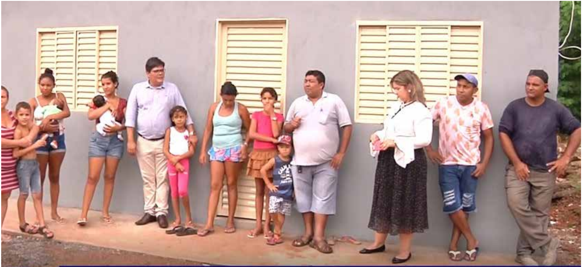
Laerte, juntamente com alguns parceiros e voluntários, tem construído e entregue casas a famílias carentes na Capital e em VG

O jornalista e apresentador Laerte Lannes, do Programa da Gente, da TV Brasil Oeste, realiza ação social que tem levado ações beneficentes para moradores de Cuiabá e Várzea Grande, com a ação denominada “Corrente do Bem”, que já construiu casas para pessoas carentes.