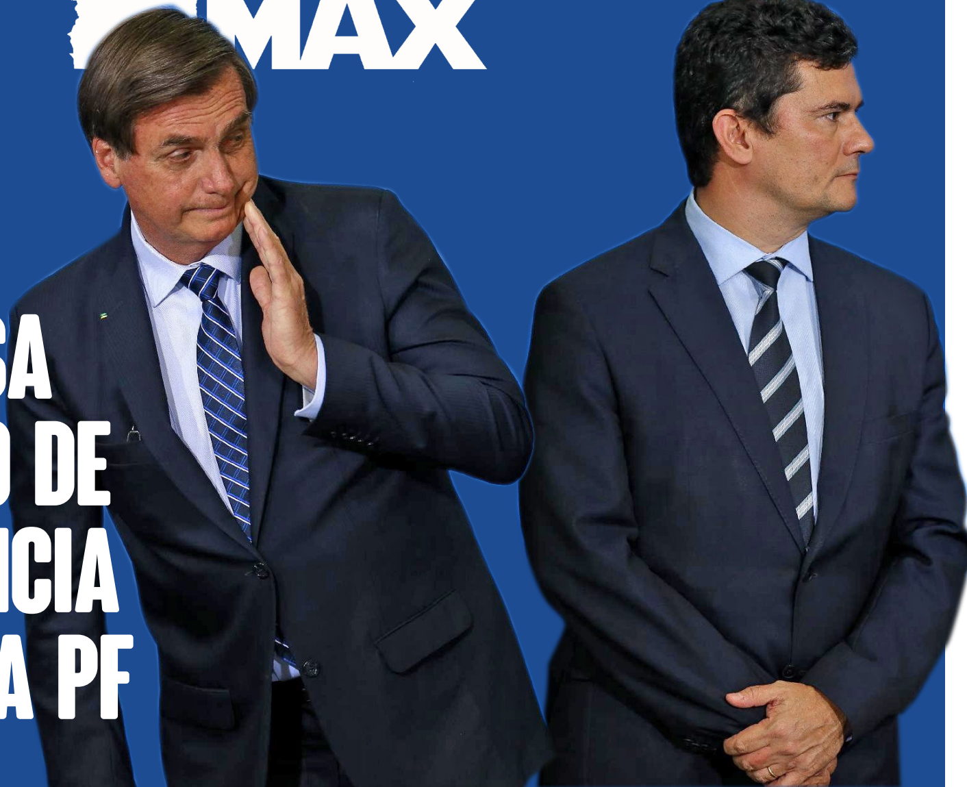
A demissão de Moro foi motivada pela decisão de Bolsonaro de trocar o diretor-geral da Polícia Federal