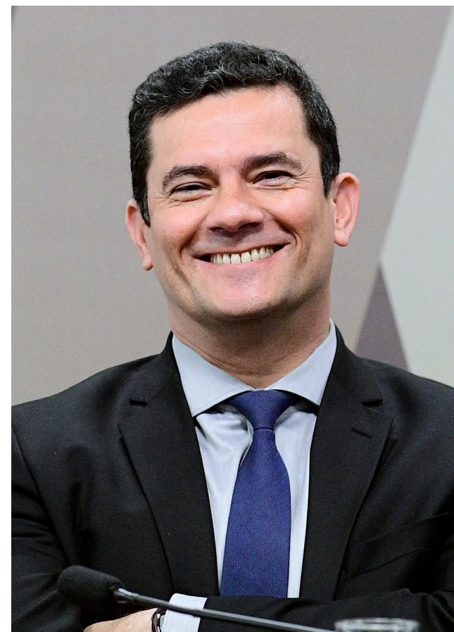
Ex-ministro acusou Jair Bolsonaro de interferência política na Polícia Federal

Ministro da Saúde, Luiz Henrique Mandetta foi demitido em 16 de abril, já o Osmar Terra saiu da pasta da Cidadania em fevereiro. No mesmo mês o ministro Gustavo Canuto foi exonerado do Desenvolvimento Regional enquanto O general Floriano Peixoto Vieira Neto saiu da Secretaria-Geral da Presidência em junho e foi nomeado presidente dos Correios. O general Carlos Alberto dos Santos Cruz, da Secretaria de Governo, também foi demitido em junho. Em abril foi o ministro da Educação, Ricardo Véliz Rodriguez, e o então ministro da Secretaria-Geral da Presidência da República, Gustavo Bebianno foi demitido em 18 de fevereiro, após sete semanas no cargo.