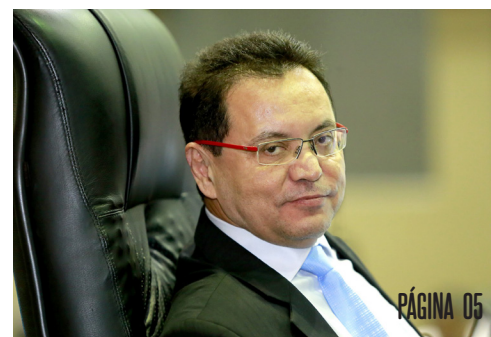
Eduardo Botelho (DEM)

Presidente da Assembleia Legislativa, o deputado Eduardo Botelho (DEM) reforçou, na semana passada, a necessidade de se aprovar linhas de créditos para ajudar pequenos e médios empreendedores nesse momento de crise, destacando a importância de se debater novas ações para ajudar o Estado a enfrentar os impactos econômicos causados pela pandemia do coronavírus.